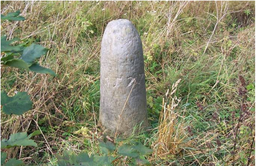
Ilustracja 5: Archiwalne zdjęcie kamienia granicznego z Błażkowej. Fotografia: Marek Lubicz-Woyciechowski, wrzesień 2004.

W moim archiwum zachowała się niestety sama treść e-maila, bez załączonego zdjęcia i mapki. Natomiast ja sam całkowicie już nie kojarzę treści korespondencji sprzed kilkunastu lat: czy była tam mowa o tym samym kamieniu, czy też w Błażkowej zachowało się więcej kamieni granicznych z 1577 roku? O wyjaśnienie moich wątpliwości postanowiłem poprosić autora, który już następnego dnia odpisał mi: „znalazłem zdjęcie kamienia z Błażkowej (...) Prawdopodobnie jest to kamień graniczny ziem należących do klasztoru w Krzeszowie (Błażkowa w połowie należała do klasztoru). Być może o ten kamień Panu chodzi” 13 . Załączony opis lokalizacji kamienia oraz jego fotografia (patrz ilustracja 5) nie pozostawiają wątpliwości, że chodzi tutaj o kamień opisywany na poprzednich stronach. Pewnym zaskoczeniem może być wyjątkowo dobra czytelność cyfr wykutych na kamieniu, jednakże jest to najprawdopodobniej wynik celowego uwypuklenia ich konturów za pomocą kredy.