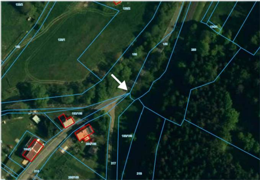
Ilustracja 3: Fragment ortofotomapy Błażkowej z widocznymi granicami działek geodezyjnych; strzałka wskazuje na pięciostyk granic, w którym znajduje się kamień graniczny z 1577 roku.

Próba zlokalizowania na współczesnych mapach działki geodezyjnej, na której znajduje się opisywany kamień, doprowadza do wniosku, że prawdopodobnie ów znak graniczny wykorzystywany jest do dziś. Jak widać na ilustracji 3, w tejże właśnie lokalizacji znajduje się punkt styku granic aż pięciu działek geodezyjnych: 160, 158, 217, 215 oraz 182/168; można więc miejsce to określić mianem „pięciostyku”.