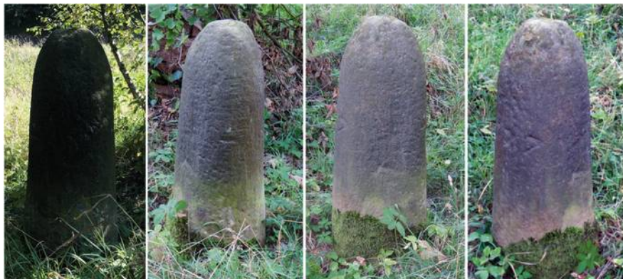
Ilustracja 1: Zdjęcia przedstawiające kamień graniczny z Błazkowej. Fotografia: Marian Gabrowski, wrzesień 2019.

W listopadzie 2017 roku wracaliśmy z moim synem Franciszkiem z wyprawy w poszukiwaniu cysterskiego kamienia granicznego w okolicach Kochanowa. Aby urozmaicić sobie drogę powrotną, zdecydowaliśmy się przejechać między innymi przez Błazkową, wioskę przed laty należąca częściowo do krzeszowskich cystersów. Właśnie podziwialiśmy miejscowość z okien samochodu, kiedy niespodziewanie naszą uwagę przykuł kamienny obiekt znajdujący się tuż przy drodze. Z daleka swoją formą przypominał on nieco kamień graniczny.